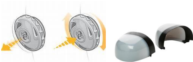
Sistema de cierre Boa