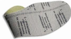
Plantilla anti-perforación flexible