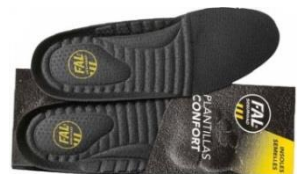
Plantillas extraíbles. Lavables