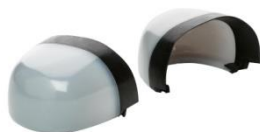
Puntera no metálica