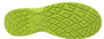
Suela Antiestática + Resistente a los hidrocarburos