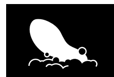
PLANTILLAS EXTRAÍBLES LAVABLES